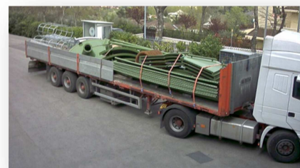
TRASPORTO VIA TERRA N.1 Silo 10CS senza accessori

Strada S. Michele, 37 Cailungo B5 BORGO MAGGIORE REPUBBLICA DI SAN MARINO Tel. +378.0549.988111 Fax +378.0549.903793 www.camsgroup.com info@camsgroup.com