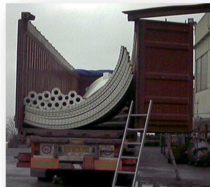
TRASPORTO VIA MARE N.1 Silo 10CS4 senza accessori in due container 40' OT