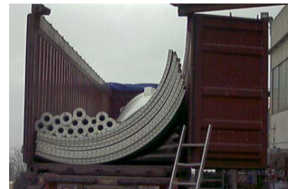
TRASPORTO VIA MARE N.1 Silo 6CS7 con accessori in due container 40' OT