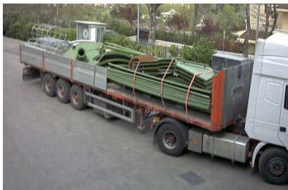
TRASPORTO VIA TERRA N.1 Silo 6CS7 con accessori su due autocarri 13.60