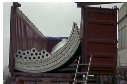
TRASPORTO VIA MARE N.3 Sili CS45 senza accessori in un container 40' OT