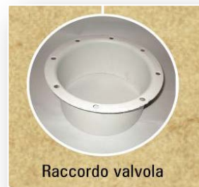
Raccordo di fissaggio Codice 35.020.1601