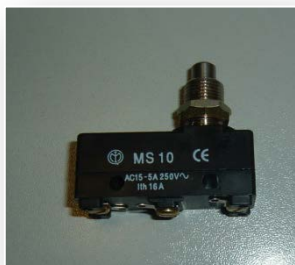
Microcontatti Codice 50.020.4190